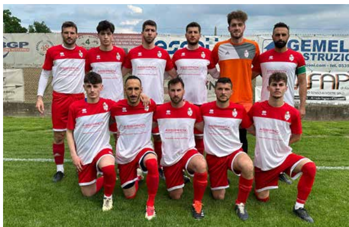
La formazione del Rivara scesa in campo contro il Carpine