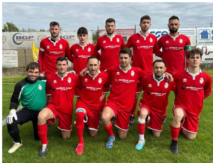
La squadra del Rivara scesa in campo contro il Bevilacqua

MARCATORI: 6' Melloni, 19' Malagoli, 41' Ghiotti, 60' Malagoli, 68' + 72' Soldano