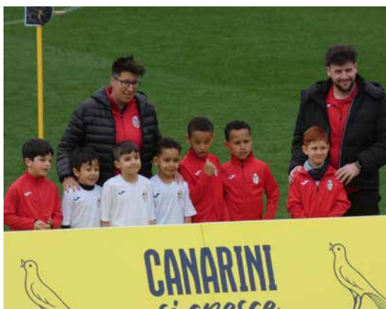
I 2018/19 impegnati allo stadio "Braglia" di Modena per la Canarini Cup