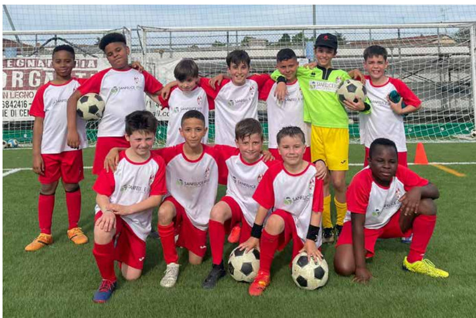
I 2015 impegnati nel torneo di Finale Emilia