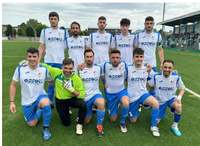
La squadra che ha giocato contro la Junior Finale