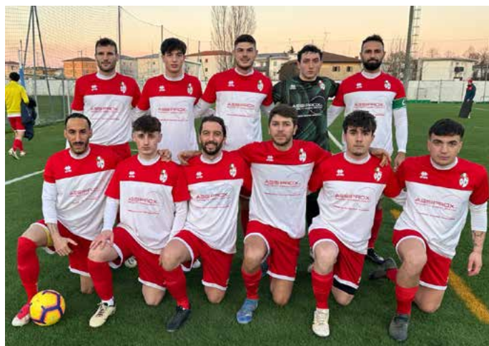
La formazione del Rivara che ha giocato contro la Nuova Aurora. Sotto alcuni momenti della partita