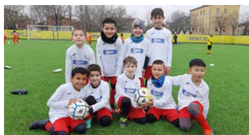
I 2017 alla Canarini Cup a Saliceta