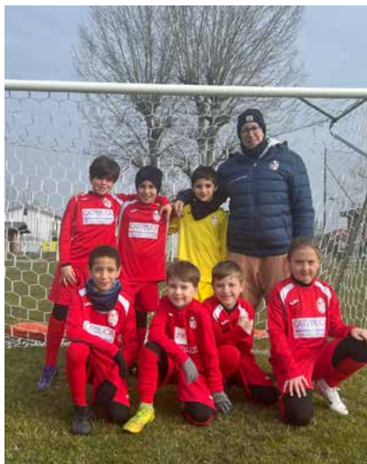
I 2016 impegnati nel raggruppamento con il Finale Emilia a Rivara

Via Lavacchi 1625 - San Felice sul Panaro (MO) Tel. 0535 84911/670196 - Fax 0535 84808 info@eurofustelle.com - www.eurofustelle.com