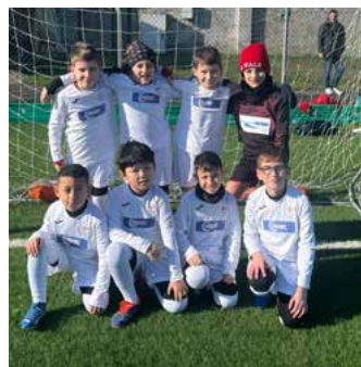
Le nostre annate 2016 impegnate nel raggruppamento di Finale Emilia