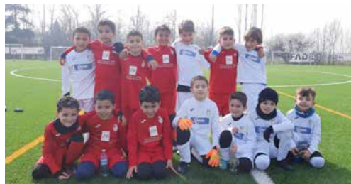
I 2017 a San Marino di Carpi