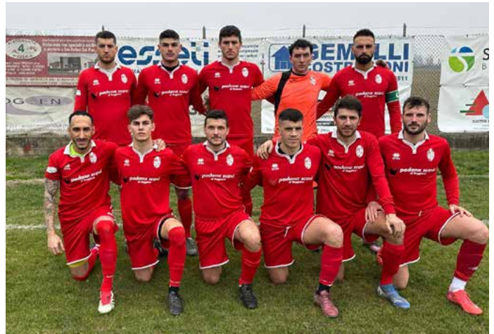
La formazione del Rivara scesa in campo a Limidi