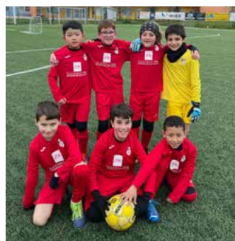
Le nostre annate 2016 impegnate nel raggruppamento di San Prospero