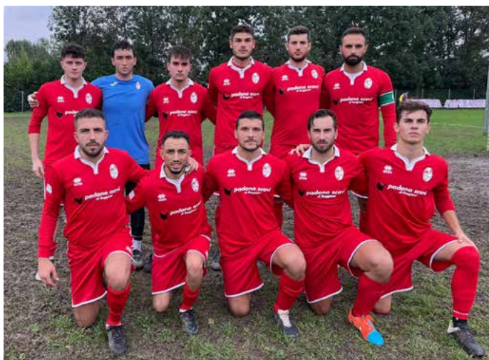
La formazione del Rivara che ha giocato contro la Sanmartinese domenica 13 ottobre scorso