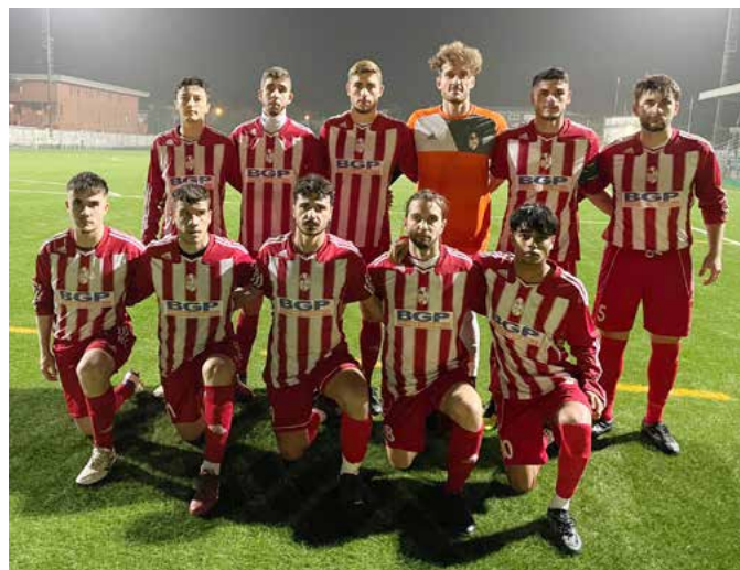
La formazione che ha giocato i quarti di finale di Coppa Emilia contro il Junior Finale