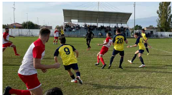
Alcuni momenti della partita contro la Sanmartinese