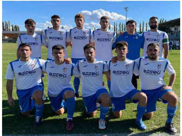
La formazione del Rivara che ha giocato contro la Sanmartinese domenica 13 ottobre scorso