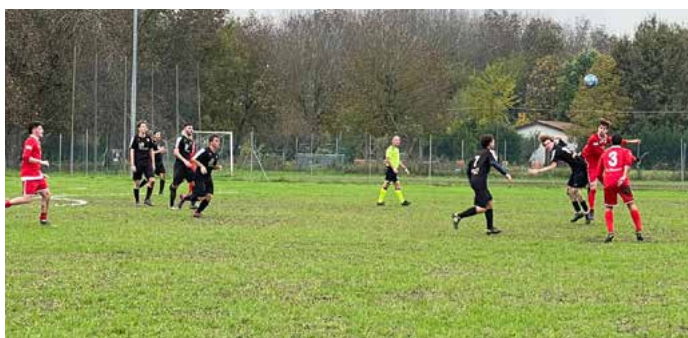
Alcuni momenti della partita contro il Cabassi