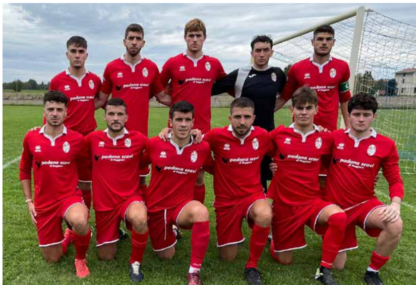
La formazione che ha giocato contro il XII Morelli domenica 6 ottobre