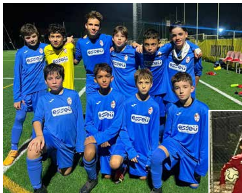
Campionato CSI Saliceta- Rivara, annata 2013