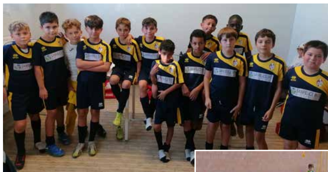
Rivara-Bimbi Sperduti cat. 2014 giocata a Rivara sabato 28 settembre 2024