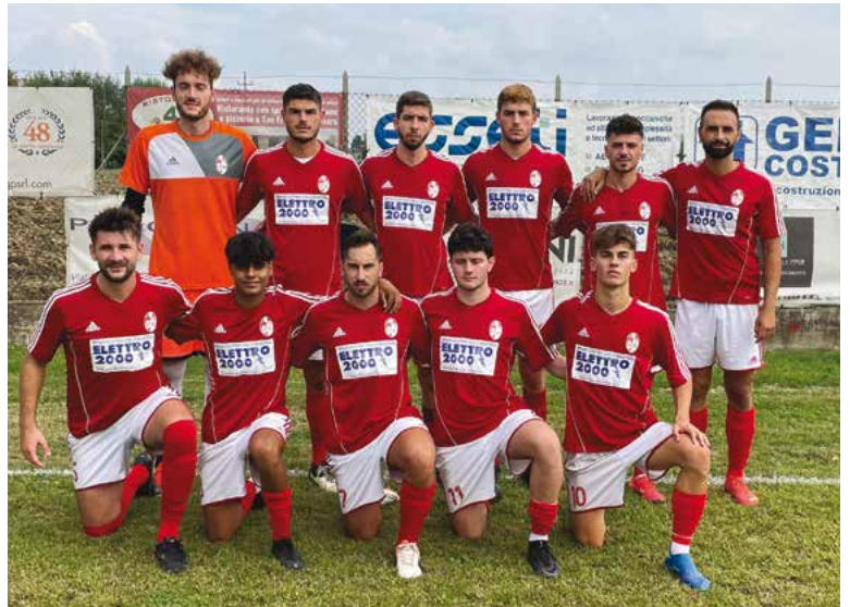
La formazione del Rivara in campo domenica scorsa contro il Limidi