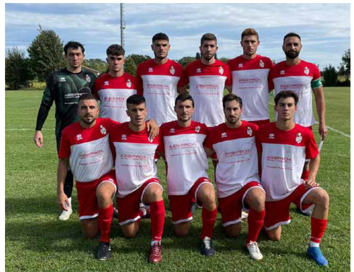
La squadra titolare che ha affrontato il Sermide