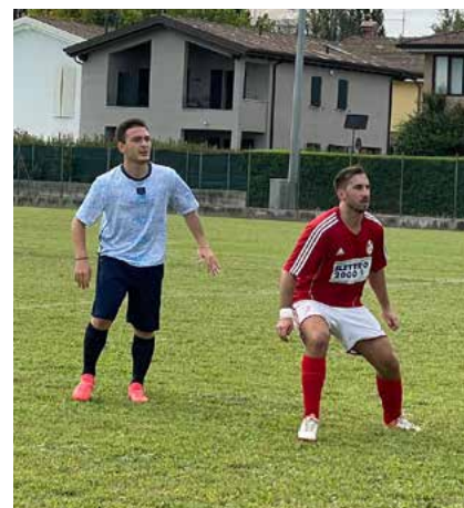
Alcuni momenti della partita contro il Limidi