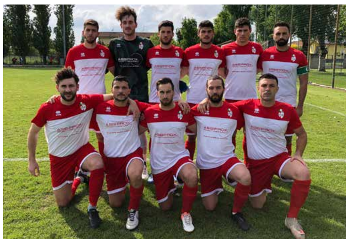
La formazione che ha giocato la semifinale Playoff