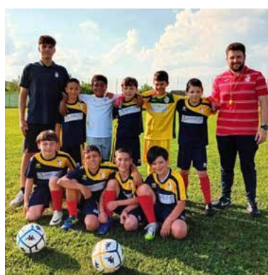
Camposanto - I 2015